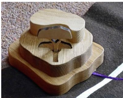
El Monte de los Olivos

Y fuera de las murallas necesitas dos sitios: