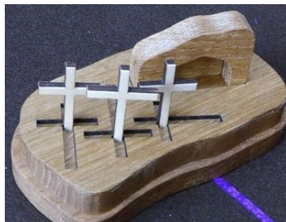
El Gólgota, con tres cruces