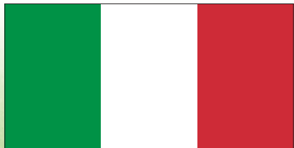
Bandera de Italia.