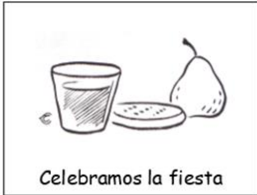
Celebramos la fiesta

Tomamos un pequeño tentempié como una galleta y algo de beber. Lo llamamos "la fiesta", porque estamos todos juntos.